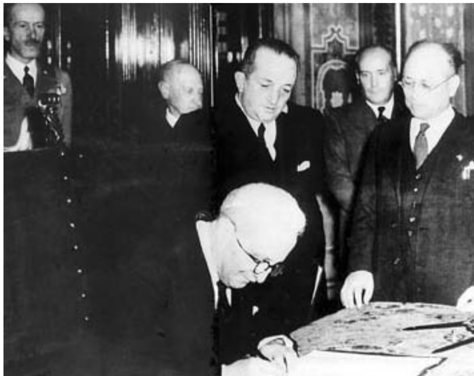
Roma, 27 dicembre 1947 (Palazzo Giustiniani)

Enrico De Nicola firma l'atto di promulgazione della Costituzione della Repubblica Italiana