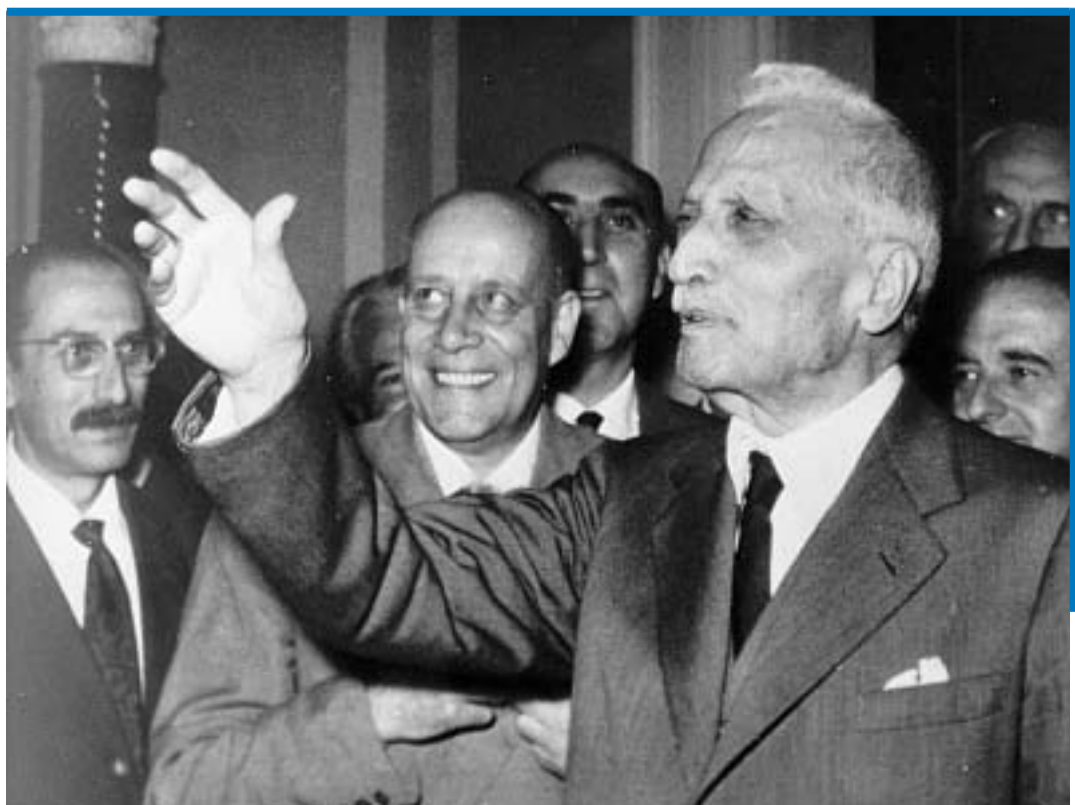
A fianco, e nelle immagini seguenti, Enrico De Nicola , Presidente della Repubblica, 1948

Ogni processo si svolge nel contraddittorio tra le parti, in condizioni di parità, davanti a giudice terzo e imparziale. La legge ne assicura la ragionevole durata.