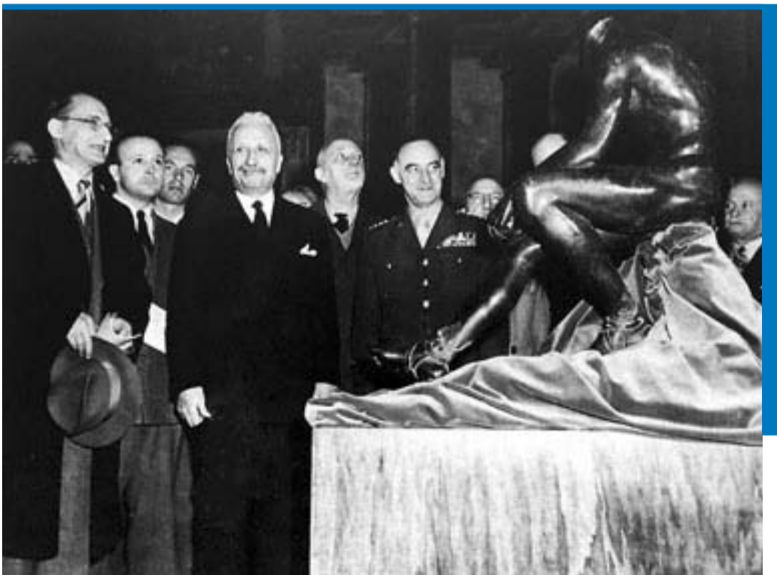
Il Presidente della Repubblica Enrico De Nicola con il Presidente del Consiglio dei Ministri Alcide De Gasperi

Art. 43. A fini di utilità generale la legge può riservare