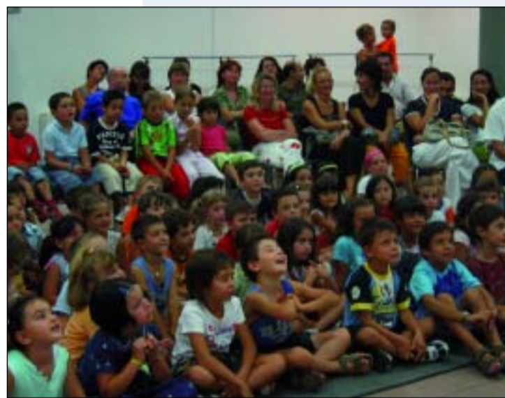
Un'immagine della Festa dei Remigini del 2006