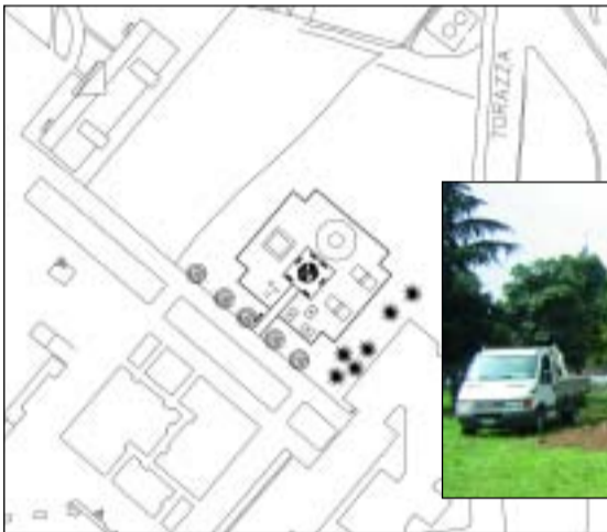
A sinistra il progetto della nuova area giochi in piazza Togliatti e sotto i lavori già avviati