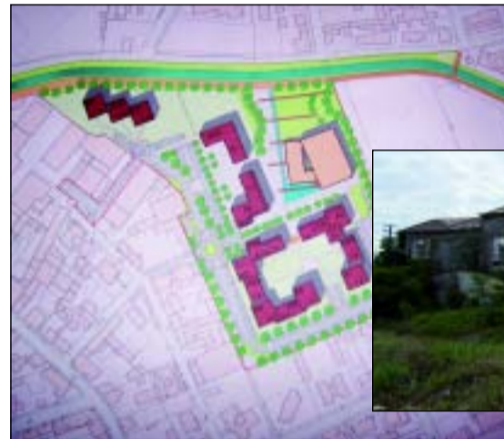
A sinistra il progetto del piano di recupero, sotto un'immagine di come è oggi l'area. A fondo pagina la tabella con le specifiche del piano