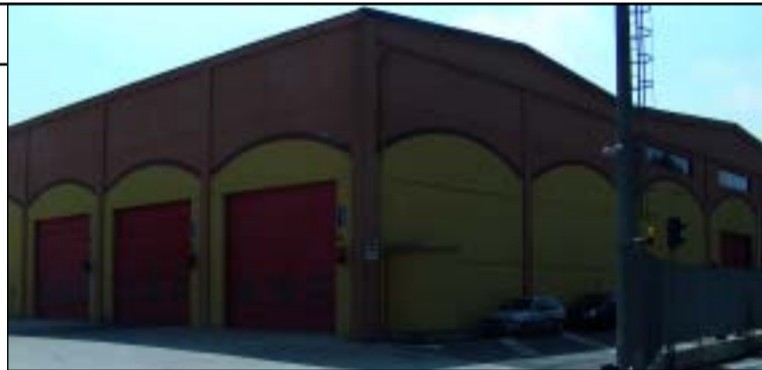
A sinistra il centro di compostaggio del Comune di Cologno nei pressi del quartiere brugherese Edilnord