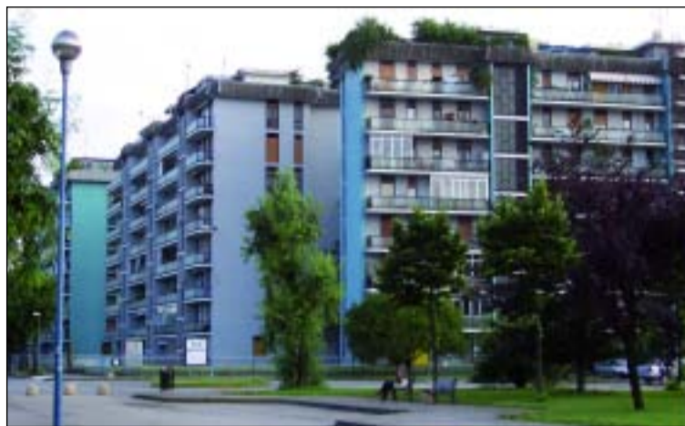
Sopra un'immagine del quartiere Edilnord, sotto il nido comunale Torazza

Un lavoro di ristrutturazione necessario che è stato fortemente voluto