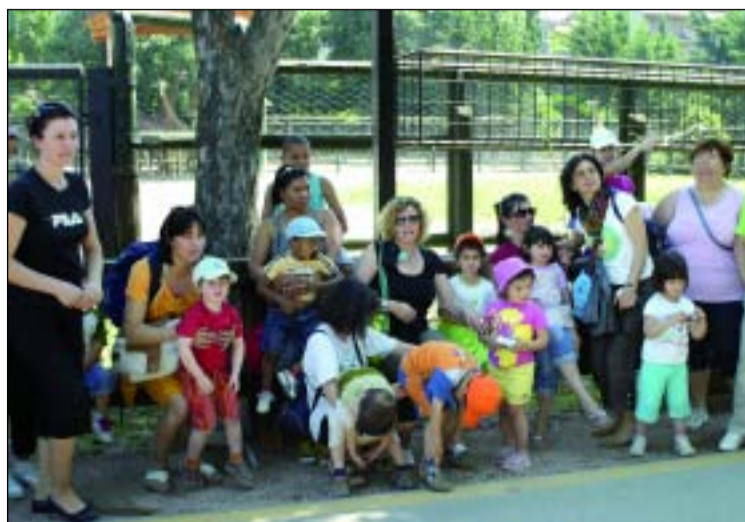
Da sinistra in senso orario il nido Torazza, il nido Kennedy e alcune insegnanti