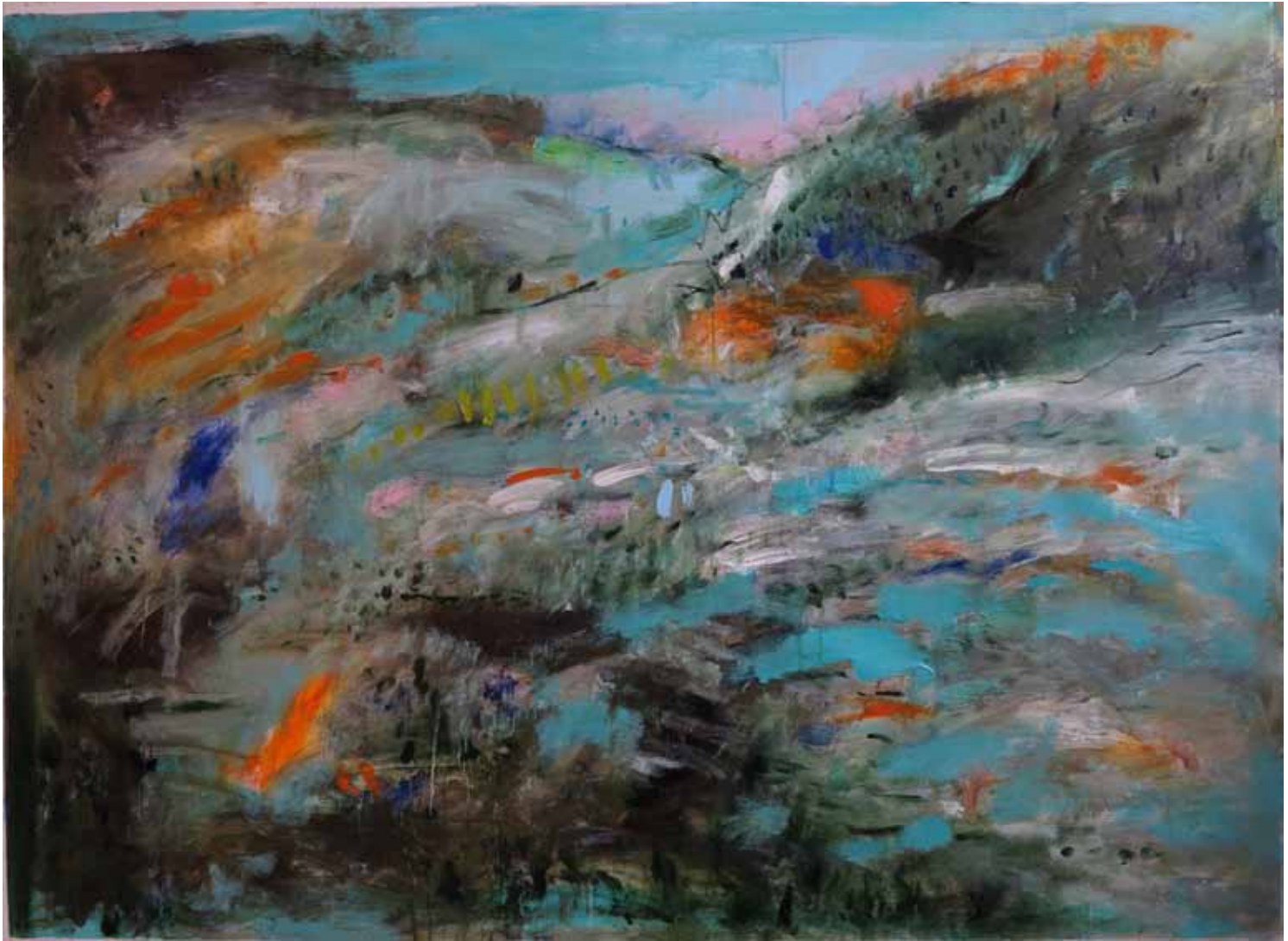
SERGIO BESUTTI 2014 Landscape olo su tela 110x150 cm.