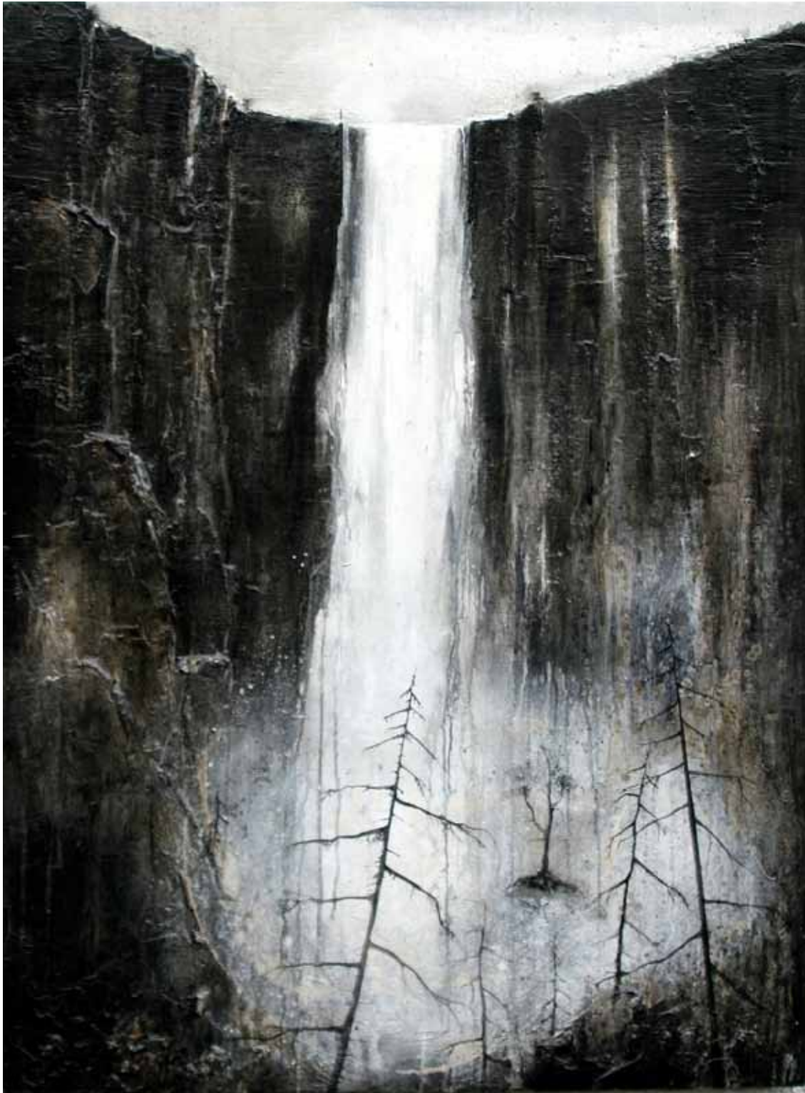
ARMANDO FETTOLINI 2012 Vizi capitali polimaterico su legno 100x140 cm.