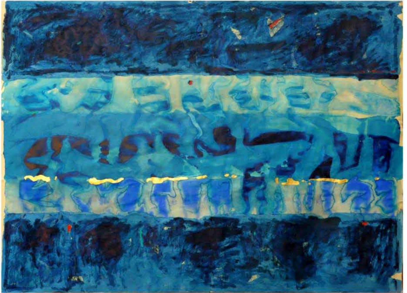
ALESSANDRO SAVELLI 2005 MALDIVES t.m. su carta 150x200 cm.